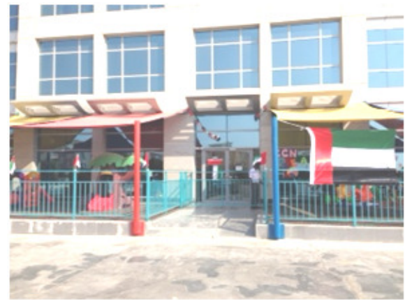
مدرسة رياض الأطفال بالخلف