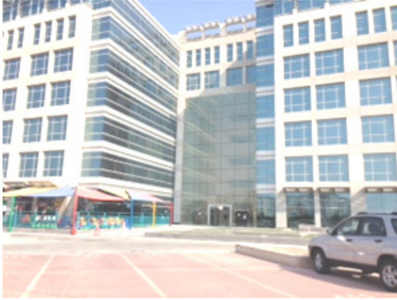
المبنى من الخلف