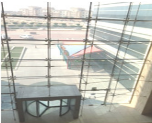
المبنى من الداخل