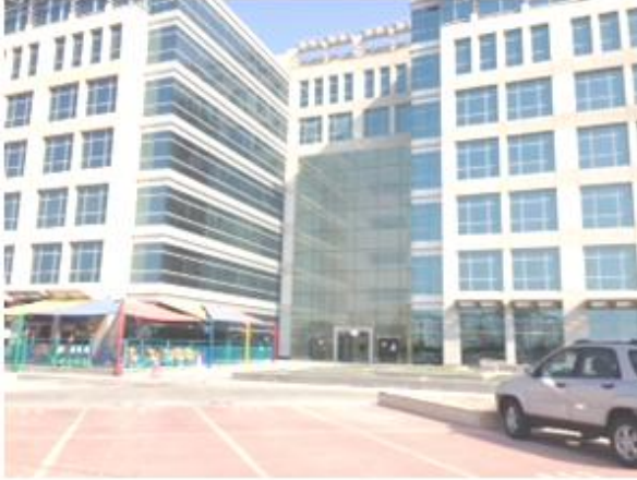
المبنى من الخلف