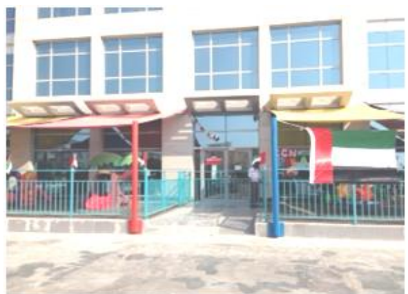
مدرسة رياض الأطفال بالخلف