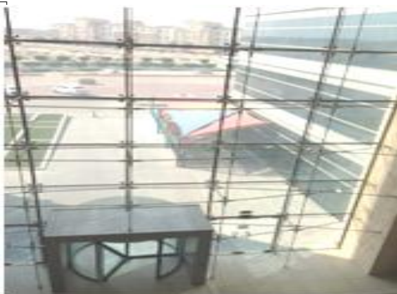
المبنى من الداخل